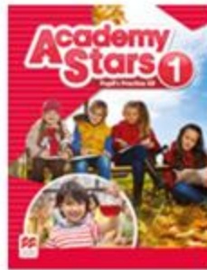
Pupil's Practice Kit